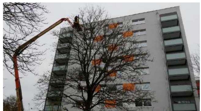
L'immeuble dans la Fasanenallee 4 juste avant sa finalisation (décembre 2020)