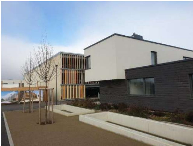
Elmen: Im Vordergrund eines der Muster-Einfamilienhäuser. Dahinter das fertiggestellte erste Parkhaus des Quartiers. Der individuelle Kfz-Verkehr ist auf die Zufahrten zu den insgesamt drei Parkhäusern beschränkt. Zusätzliche Parkmöglichkeiten bei den Häusern und Wohnungen gibt es keine.

sichtlich im September 2022 können die ersten Personen einziehen. Die Infrastrukturarbeiten des ersten der drei neuen „Dörfer“ (Phase 1) begannen im Juli 2018. Bei dem Bau des Viertels handelt sich um das größte Wohnungsbauprojekt im ländlichen Raum Luxemburgs, das sich durch seinen innovativen Charakter auszeichnet. Das nachhaltige Vorzeigeprojekt stellt neben der Lebensqualität auch die soziale und generationsübergreifende Mischung in den Vordergrund. Eine weitere Besonderheit sind die Einfamilienhäuser, welche als Holzhäuser errichtet werden. Außerdem wird das Wohngebiet im Kern autofrei sein.