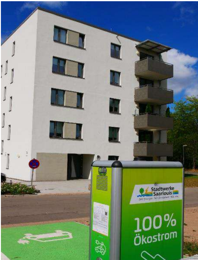
Neubau Husarenweg 12 a nach der Fertigstellung. Im Vordergrund die neue Ladestation für Elektroautos der Stadtwerke Saarlouis

Découvrez dans la section suivante les événements GReNEFF qui vous attendent dans les prochains mois !