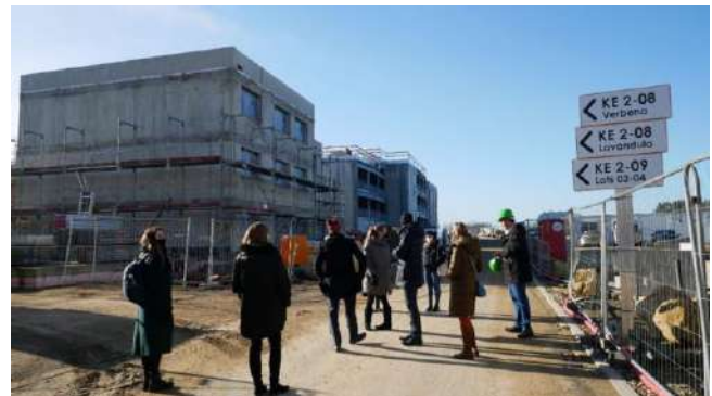
Visite du chantier à « Elmen » le 13/01/2022 : le nouveau quartier en cours de construction séduit par sa taille – même si l'on ne voit jusqu'à présent que la première tranche de construction.

Aus dem weiten Spektrum nachhaltiger Maßnahmen des Projekts standen insbesondere der Einsatz erneuerbarer Energien, intelligente, „smarte“ Lösungen, die