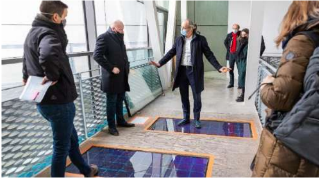
Minister Turmes bei der Besichtigung begehbare Photovoltaikmodule im Innenbereich. Eine interessante Lösung für Lichtkorridore und Zugänge innerhalb von Gebäuden.

spezifischen Cluster-Ansatz, um Innovationen zu fördern und zu erleichtern, mit dem Ziel einer langfristigen Valorisierung der Errungenschaften für die luxemburgische Wirtschaft.