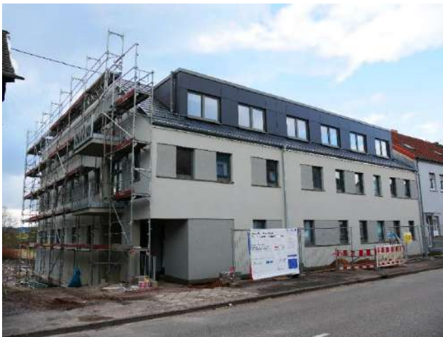
Sozialer, barrierefreier Wohnungsbau in der Herrenstraße in Saarlouis-Roden

wegweisende Pilotprojekte vor, die im Rahmen des Projektes GReNEFF unterstützt werden. Zahlreiche wallonische Teilnehmer*Innen dokumentierten das grenzüberschreitende Interesse an dieser Thematik. Die Neubauten in der Herrenstraße in Saarlouis-Roden und im Quartier Husarenweg erfüllen die Energiestandards KfW 40 und 40 plus, die Sanierung zweier Wohnblocks aus den 60er Jahren an der Fasanenallee den Standard KfW 55 und damit die Anforderungen an ein „Nearly Zero Emission Building“.