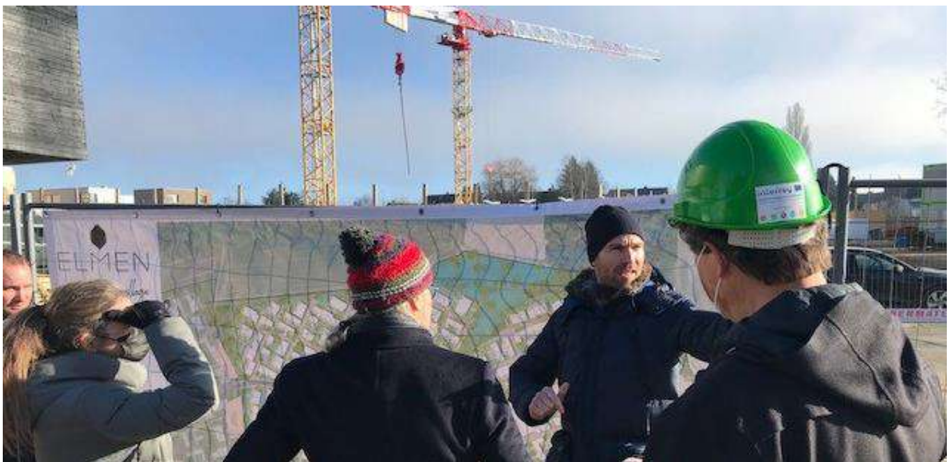
Inspirierender Ort für die Abschlussveranstaltung am 12. Mai: Die Baustelle in ELMEN. Un lieu inspirant pour la manifestation de clôture du 12 mai : le chantier d'ELMEN.

De plus amples informations sur le programme et l'inscription suivront prochainement.